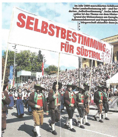
Im Jahr 2009 marschierten Schützen beim Landesfestzug mit – und forderten „Selbstbestimmung“. Sechs Jahre später ist das Thema vor dem Hintergrund der Diskussionen um Euroregio, Autonomiekonvent und Doppelstaatsbürgerschaft aktueller denn je.

im Beschluss des österreichischen Nationalrats vom 8. Juli 2015, dessen Begründung lautet: „Selbstbestimmung kann auf verschiedene Weise verwirklicht werden. Für Österreich besteht kein Zweifel, dass die Südtirol-Autonomie völkerrechtlich auch auf dem Selbstbestimmungsrecht beruht, das als fortbestehendes Recht von Südtirol in Form weitgehender Autonomie ausgeübt wird. Die Südtirol-Autonomie mit hohem Maß an Selbstgesetzgebung und Selbstverwaltung ist eine besonders gelungene Form der Selbstbestimmung.“ Olt vermeint nun, dass sich Wien mit dieser Formulierung anschieke, auf das Selbstbestimmungsrecht für die Südtiroler zu verzichten. Er meint, wenn Österreich feststelle, dass die Südtirol-Autonomie eine besondere Form der Selbstbestimmung sei, dann sei die Selbstbestimmung bereits verwirklicht und könne daher nicht mehr gefordert werden. Dieser Argumentation hält Khol in seiner Replik entgegen, dass das Selbstbestimmungsrecht dem Volk