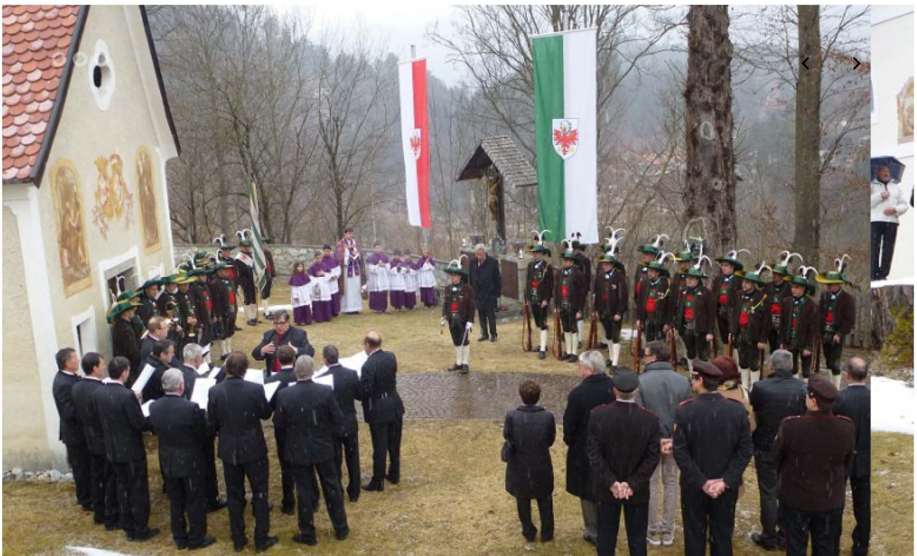
Andreas-Hofer-Gedenkfeier in Ehrenburg

Altlandeshauptmann Wendelin Weingartner lies am vergangenen Sonntag bei der Andreas-Hofer-Feier in Ehrenburg als Gedenkredner mit einigen Aussagen aufhorchen.