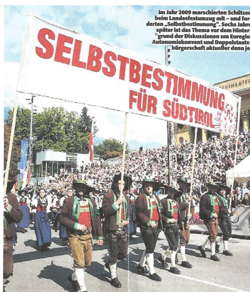
Im Jahr 2009 marschierten Schützen beim Landesfestzug mit – und forderten „Selbstbestimmung“. Sechs Jahre später ist das Thema vor dem Hintergrund der Diskussionen um Euroregio, Autonomiekonvent und Doppelstaatsbürgerschaft aktueller denn je.

im Beschluss des österreichischen Nationalrats vom 8. Juli 2015, dessen Begründung lautet: „Selbstbestimmung kann auf verschiedene Weise verwirklicht werden. Für Österreich besteht kein Zweifel, dass die Südtirol-Autonomie völkerrechtlich auch auf dem Selbstbestimmungsrecht beruht, das als fortbestehendes Recht von Südtirol in Form weitgehender Autonomie ausgeübt wird. Die Südtirol-Autonomie mit hohem Maß an Selbstgesetzgebung und Selbstverwaltung ist eine besonders gelungene Form der Selbstbestimmung.“ Olt vermeint nun, dass sich Wien mit dieser Formulierung anschieke, auf das Selbstbestimmungsrecht für die Südtiroler zu verzichten. Er meint, wenn Österreich feststelle, dass die Südtirol-Autonomie eine besondere Form der Selbstbestimmung sei, dann sei die Selbstbestimmung bereits verwirklicht und könne daher nicht mehr gefordert werden. Dieser Argumentation hält Khol in seiner Replik entgegen, dass das Selbstbestimmungsrecht dem Volk