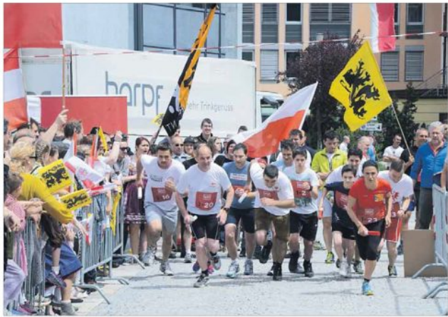
Flagge zeigen und auch sportlicher Einsatz für die Selbstbestimmung: Der Schützenbund hatte zum Unabhängigkeitstag nach Bruneck geladen. Der Tag bot Politisches, aber auch Unterhaltung und Sport.