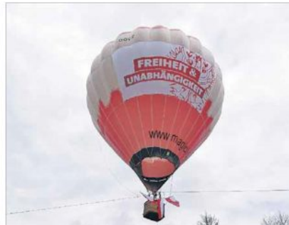
Nicht zu übersehen war das Motto des Tages: Auch ein Heißluftballon stieg für Freiheit und Unabhängigkeit in die Luft.