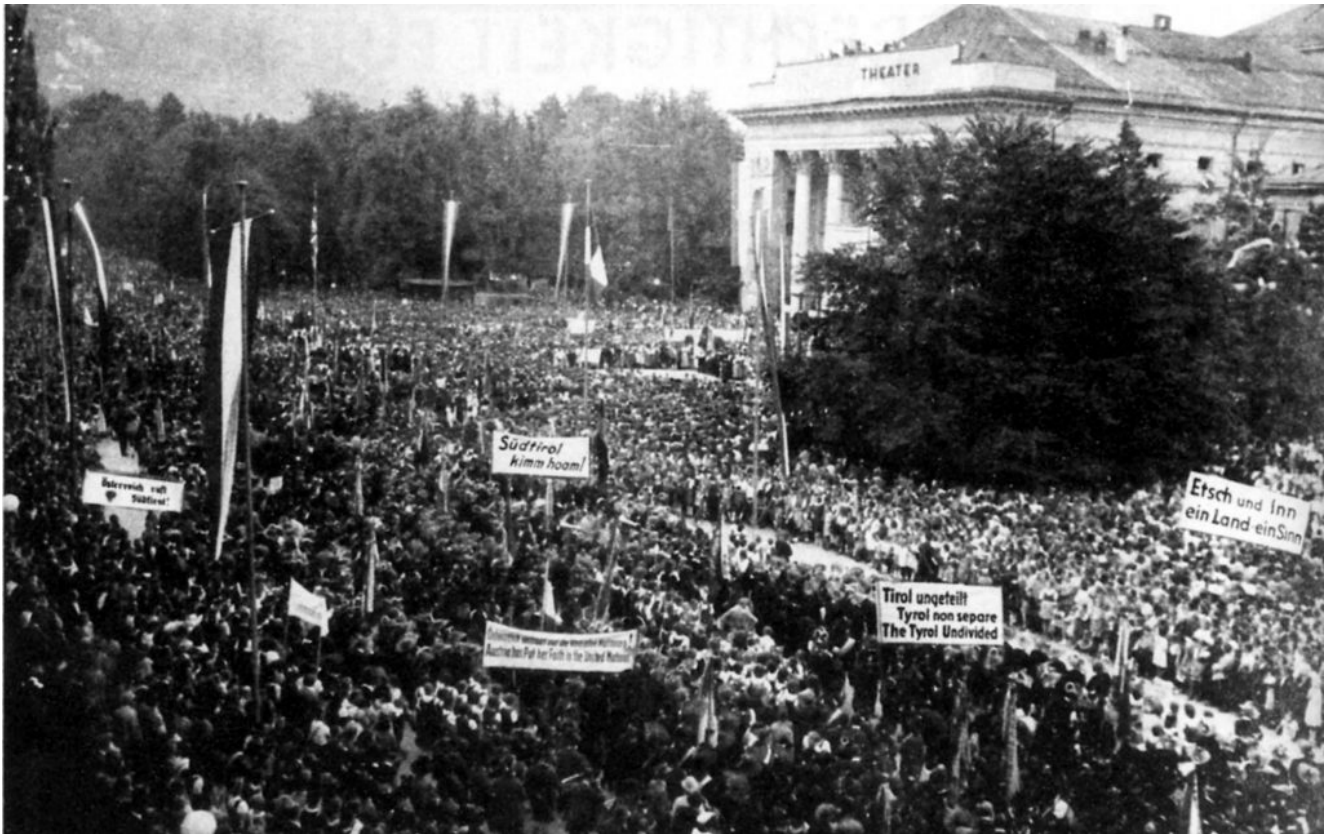
Selbstbestimmungs-Kundgebung in Innsbruck am 4. September 1945