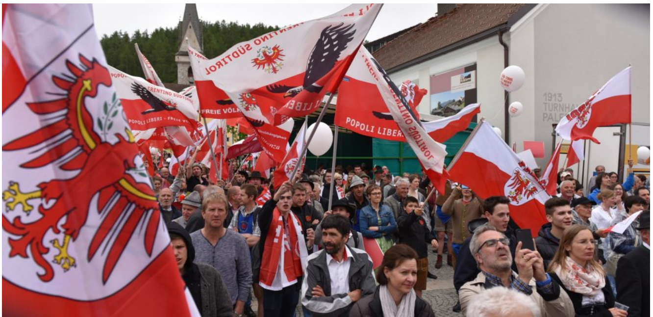
Unabhängigkeitstag in Bruneck 2016

Die Schützen wissen, dass sie mit derartigen Aktivitäten mitunter auf Ablehnung stoßen: nicht allein in Rom (zur Gänze) sowie (weithin) in der politischen Klasse Wiens und Innsbrucks, sondern auch und vor allem bei der SVP. Die 1945 gegründete „Sammelpartei“ hat sich längst mit den obwaltenden, weil mitgestalteten Verhältnissen arrangiert. Dem Arrangement fiel das in ihren Parteistatuten als