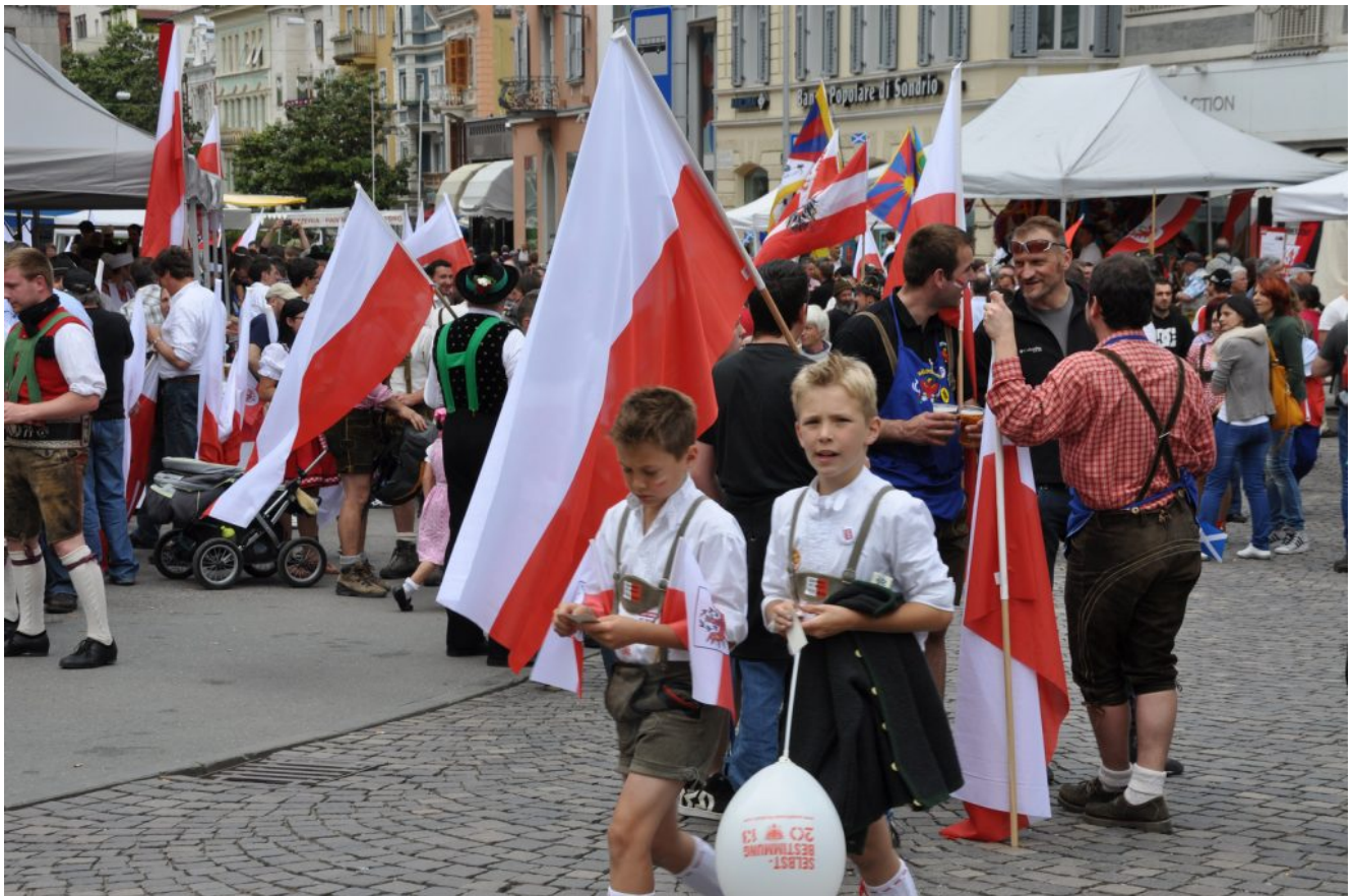
Unabhängigkeitstag in Meran 2013