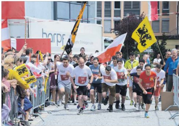
Flagge zeigen und auch sportlicher Einsatz für die Selbstbestimmung: Der Schützenbund hatte zum Unabhängigkeitstag nach Bruneck geladen. Der Tag bot Politisches, aber auch Unterhaltung und Sport.