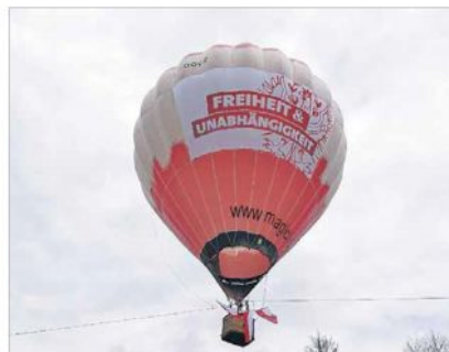
Nicht zu übersehen war das Motto des Tages: Auch ein Heißluftballon stieg für Freiheit und Unabhängigkeit in die Luft.