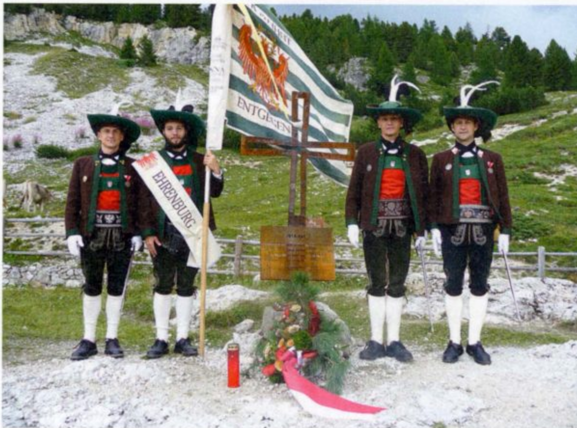
Segnung des Standschützenkreuzes auf der Plätzwiese im Rahmen der Aktion „An der Front“.