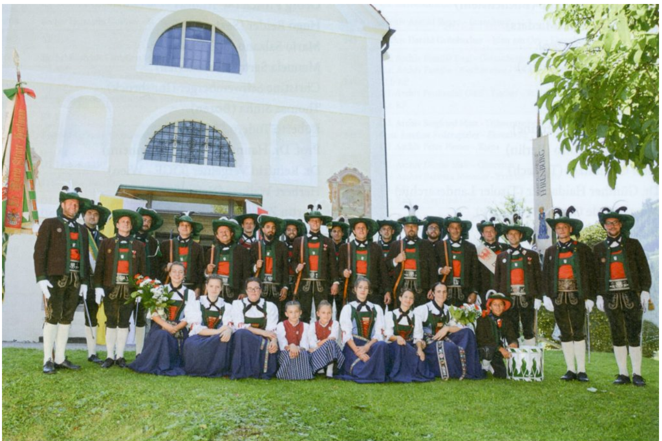
Die Schützenkompanie Ehrenburg nach der Prozession am Hoch-unser-Frauentag am 15. August 2017.

Mit einem Werk, welches vordergründig ein Lokalgeschehen – das „Schicksal der Gemeinde Kiens im Ersten Weltkrieg“ – behandelt, ist dem Herausgeber, der Schützenkompanie Ehrenburg, in Wahrheit eine kulturhistorische und heimatpflegerische Großtat gelungen.