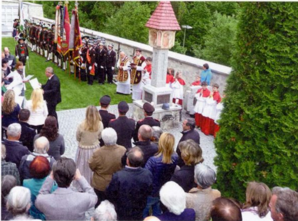
Gedenkfeier in Kiens zum 100. Jahrestag der Kriegserklärung Italiens an Österreich-Ungarn.