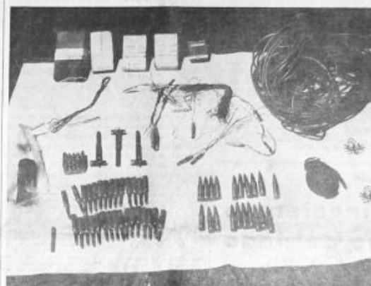
LA SQUADRA DI POLIZIA HA TROVATO QUESTI ARMI E ESPLOSIVI IN UNO DEI LOCALI PUBBLICI DI BRUNICO

La «Tina Repubblica» ha commentato l'arresto del barone Carlo Bazan, presidente del Banco di Sicilia, con un articolo di fondo intitolato «L'arresto di Carlo Bazan». L'articolo, firmato da un autore anonimo, è un'analisi critica della situazione del Banco di Sicilia e del ruolo di Bazan. Si parla di «un sistema di favori e di complicità» che ha permesso al Banco di accumulare debiti e di perdere la fiducia del pubblico. Si accenna anche a «pressioni e complicità corruzione» che avrebbero favorito Bazan.