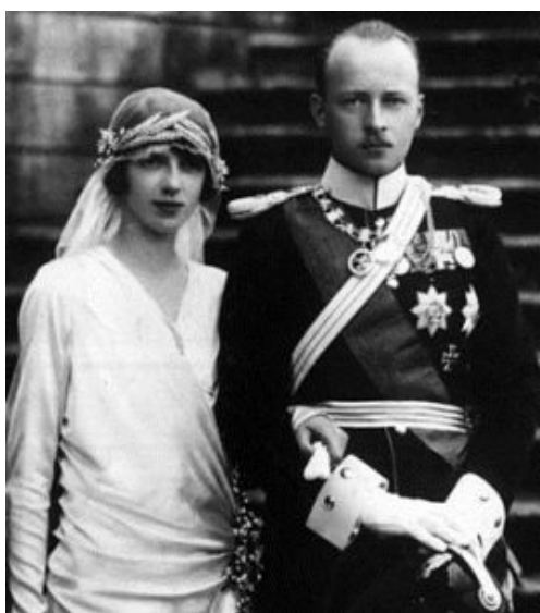
Prinz Philipp von Hessen mit seiner Gattin Mafalda

Was die Menschen nun bei Hitlers Einmarsch nicht wussten, war, dass zu diesem Zeitpunkt bereits ein Vertrauensmann Hitlers in Rom bei dem Diktator Benito Mussolini weilte. Es war dies Prinz Philipp von Hessen , ein Schwiegersohn des italienischen Königs und Gruppenführer der SA sowie Träger des Goldenen Parteiabzeichens der NSDAP.