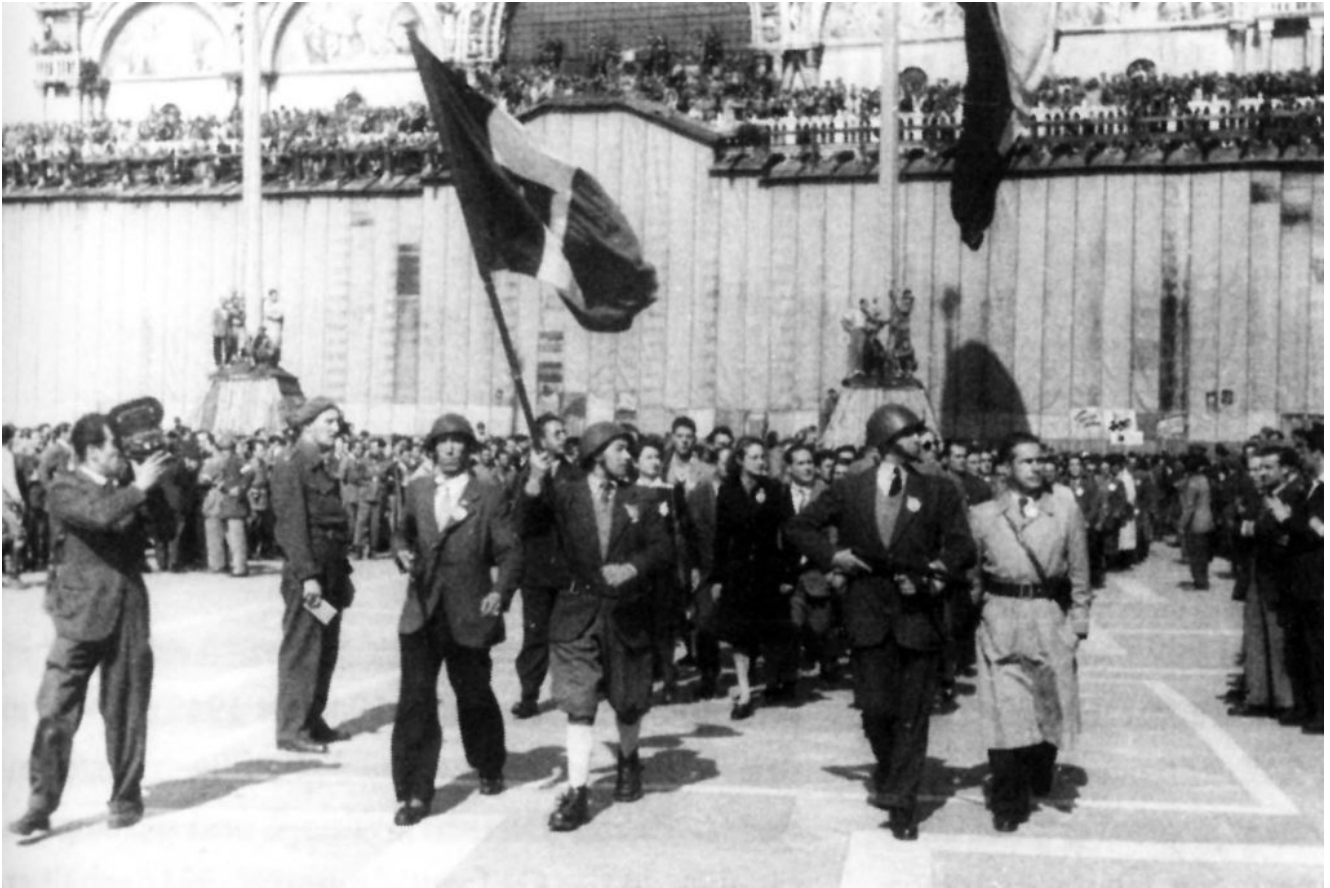
Partisanen-Parade mit anschließender Waffenabgabe 1945 in Venedig

So geschah es dann auch. Die britische und amerikanische Armee ließ die Partisanen heroische Siegesparaden abhalten, an deren Ende die Partisanenführer unter Trompetenstößen und Trommel-TamTam mit Heldengedenkmedaillen ausgezeichnet, mit Verdienstdiplomen versehen und mit Geldprämien beschenkt wurden. Anschließend durften die Partisanen unter den wachsamen Augen der Alliierten feierlich ihre Waffen abgeben.