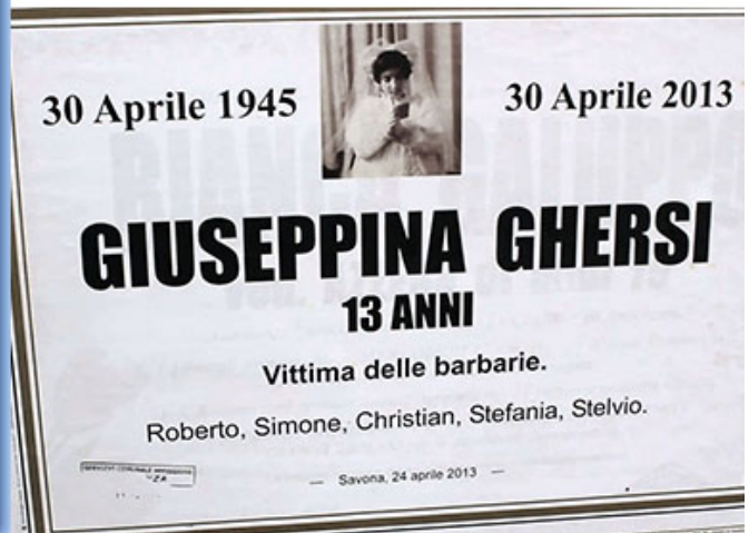
Bild links: So verherrlichten sich die kommunistischen Partisanen auf Plakaten im Nachhinein selbst. Bild rechts: Gedenken von Angehörigen im Jahre 2013 an ein kleines 13jähriges Mädchen, welches Ende April 1945 das Opfer („vittima“) der Barbarei („delle barbarie“) sogenannter „Partisanen“ geworden war.