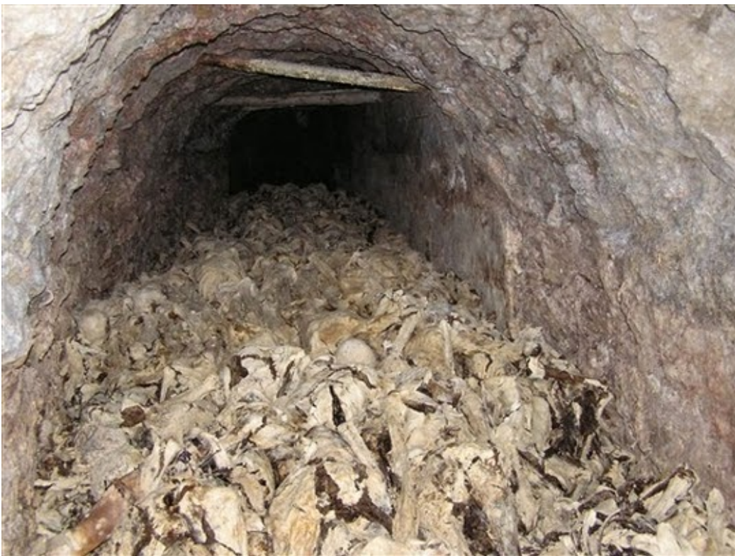
Kommunistische italienische Partisanen marschierten am 8. Mai 1945 auf einer „Siegeparade“ in Pola hinter einer Tricolore mit