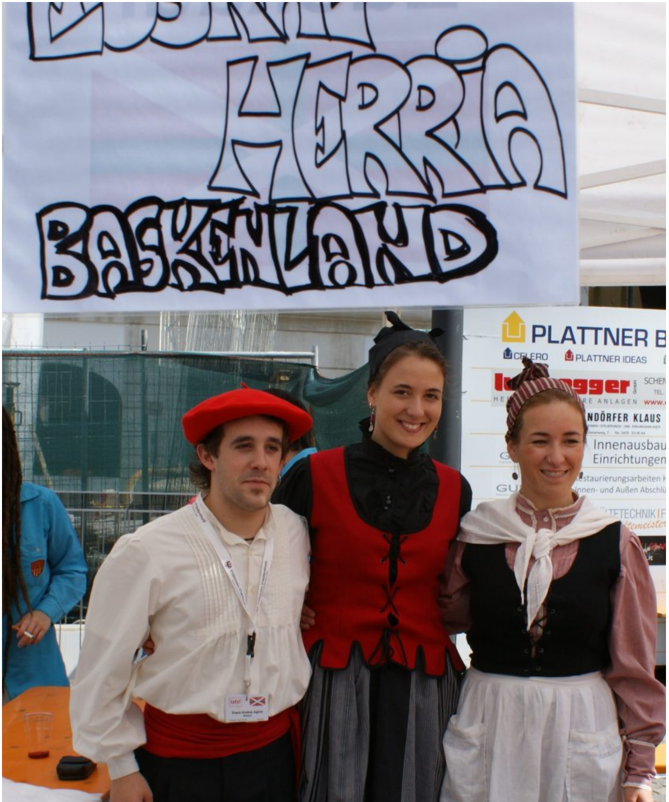
Basken auf dem Freiheitsfest in Meran

Was für Schotten und Nordiren gilt, gilt umso mehr für Katalanen und Basken. Nicht die Katalanen, die sich in – von Madrid nicht anerkannten – Referenden bisher am weitesten vorwagten, sondern die Basken waren die ersten, die – anfangs und über Jahre hin mit blutigen Anschlägen – die Trennung von