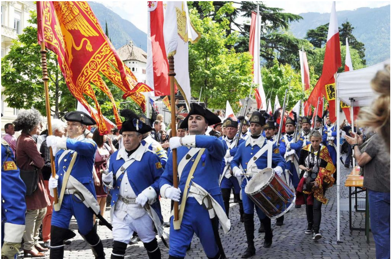
Die Veneter hatten 2013 auf dem Meraner Freiheitsfest mit einer Bürgergarde in historischen Uniformen für die