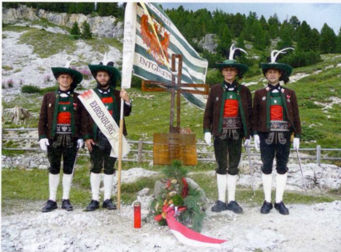
Segnung des Standschützenkreuzes auf der Plätzwiese im Rahmen der Aktion „An der Front“.