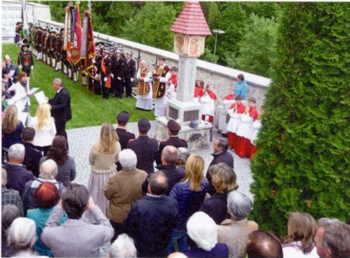
Gedenkfeier in Kiens zum 100. Jahrestag der Kriegserklärung Italiens an Österreich-Ungarn.