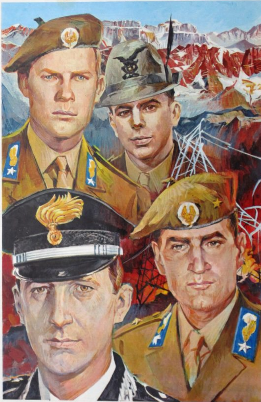
Disegno di Uggeri

Die italienische Presse nahm von Anfang an die offizielle Version als gegeben hin, wonach die Toten auf der Porzescharte Opfer eines mörderischen Anschlags von „Terroristen“ gewesen