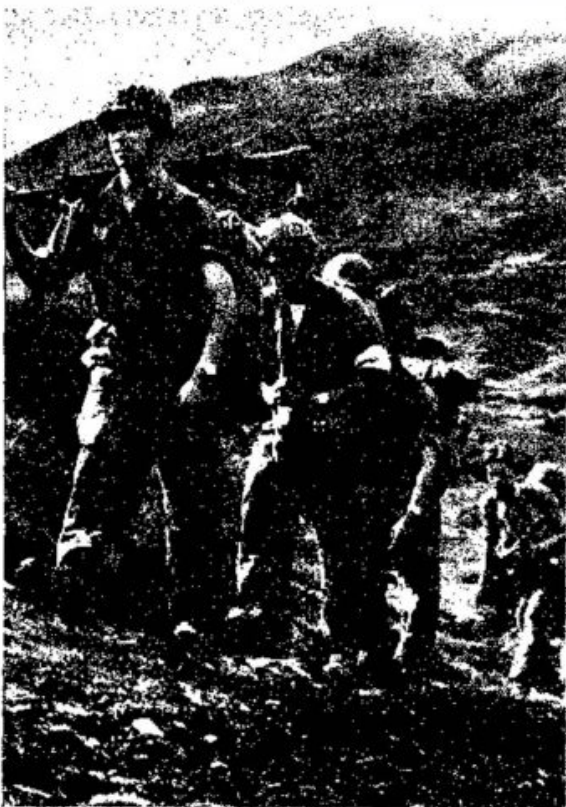
Bundesheer an der Italien-Grenze Blockade am Lebensnerv

Seit dem Sommer 1961 versuchten Tiroler Terroristen — in Österreich