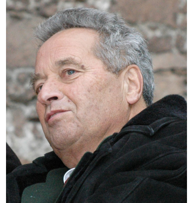
Altlandeshauptmann Wendelin Weingartner

Und die „Tiroler Tageszeitung“, alles andere als den Südtiroler Freiheitskämpfern wohlgesonnen, blieb aufgrund eigener Recherchen beharrlich dabei, dass es sich bei dem Vorfall um ein Unglück gehandelt