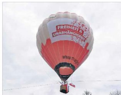
Nicht zu übersehen war das Motto des Tages: Auch ein Heißluftballon stieg für Freiheit und Unabhängigkeit in die Luft.