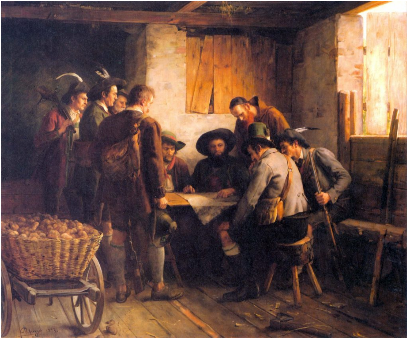
Kriegsrat Andreas Hofers (Gemälde von Franz von Defregger)