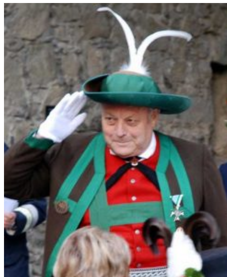
Alt-Landeshauptmann Luis Durnwalder

Dr. Luis Durnwalder (Alt-Landeshauptmann, Landesrat, Mitglied der Regionalregierung, Direktor des Südtiroler Bauernbundes, Parteiobmann-Stv. der SVP, Ehrenmitglied der Schützenkompanie Pfalzen)