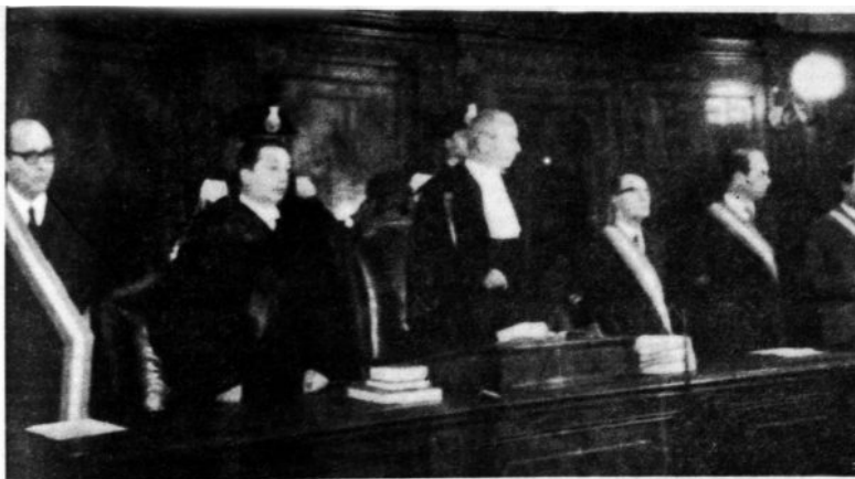
Der Schwurgerichtshof in Bologna, der vorgestern das drakonische Urteil im Pusterer-Prozeß fällt. Mit der grün-weiß-roten Schleife um die Schultern, erblickten die Geschworenen in den Taten der Angeklagten sogar eine Gefahr für die „Tricolore“ auf dem Brenner