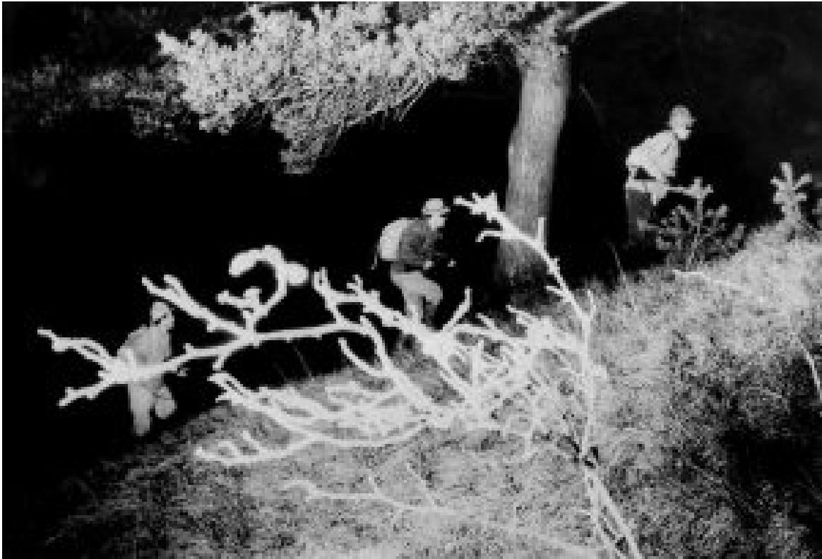
Freiheitskämpfer im nächtlichen Einsatz

Auch nach ihrem offiziellen Ausscheiden aus der Führungsebene des BAS hielten Molden, Pfaundler und Bacher weiterhin Kontakt zu tatkräftigen Einsatzgruppen und unterstützten diese.