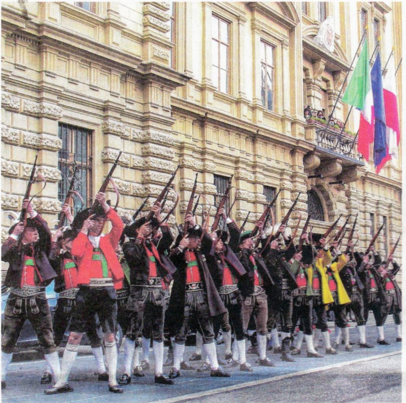
Südtirols Schützen werden beim Staatsbesuch der beiden Präsidenten Sergio Mattarella und Alexander Van der Bellen am 11. Juni in Bozen keine Ehrensalve abschießen.