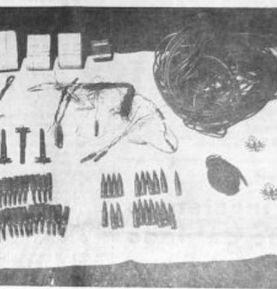
LA MONTAGNA DI IL MATERIALI ESPLOSIVI E PROPAGANDISTICI SEQUESTRATI DALLE FORZE DI POLIZIA IN VALLE AURINA. A DESTRA NELL'INFERNO UNO DEI SEQUESTRI E UNO DEI SEQUESTRI