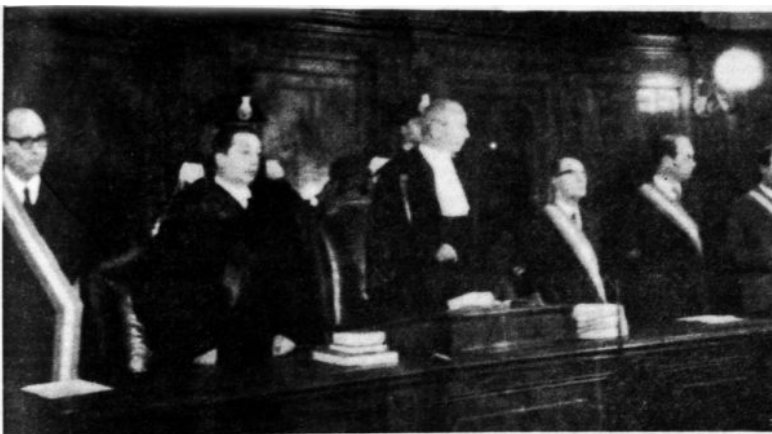
Der Schwurgerichtshof in Bologna, der vorgestern das drakonische Urteil im Pusterer-Prozeß fällt. Mit der grün-weiß-roten Schleife um die Schultern, erblickten die Geschworenen in den Taten der Angeklagten sogar eine Gefahr für die „Tricolore“ auf dem Brenner