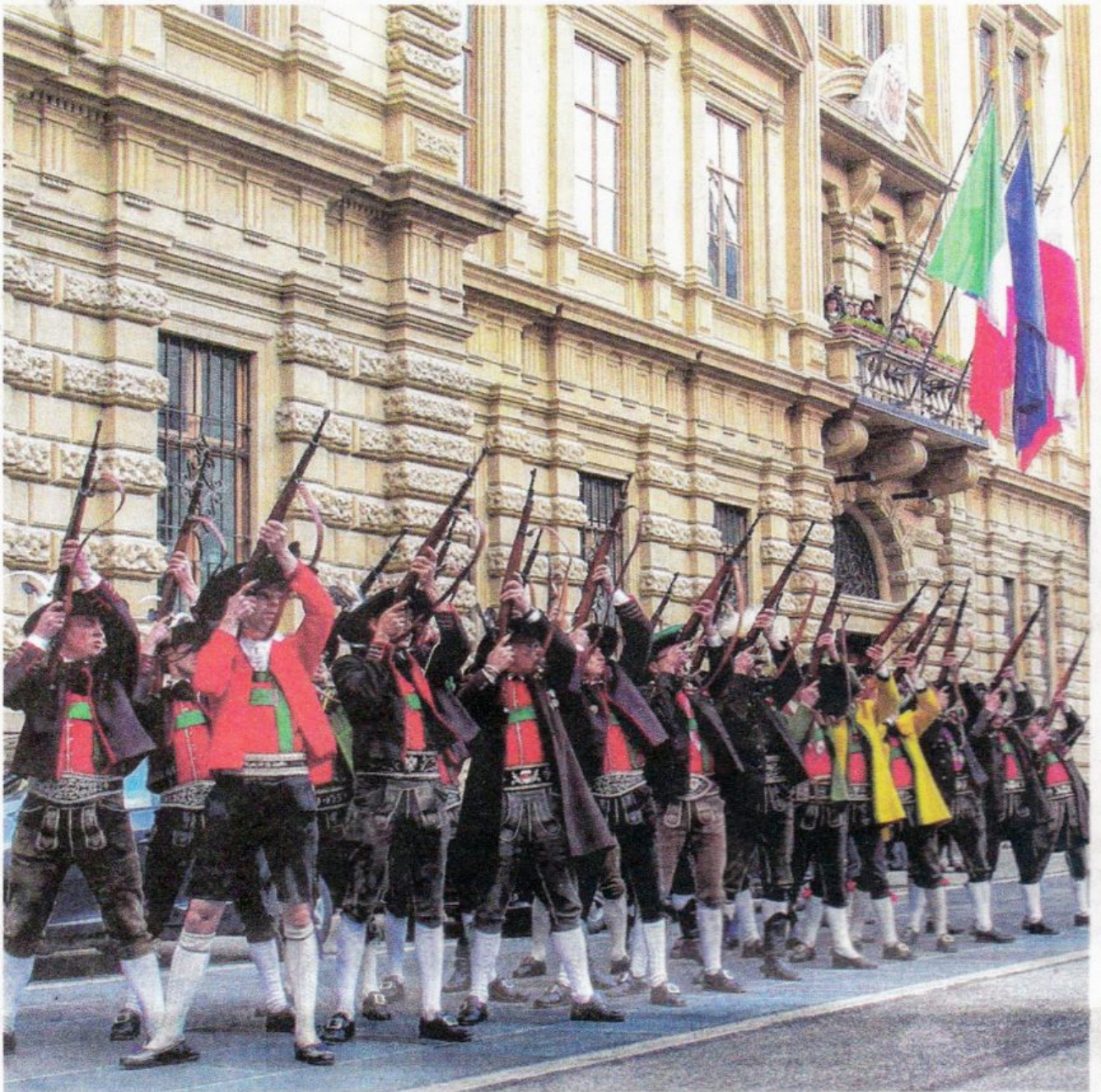
Südtirols Schützen werden beim Staatsbesuch der beiden Präsidenten Sergio Mattarella und Alexander Van der Bellen am 11. Juni in Bozen keine Ehrensalue abschießen.