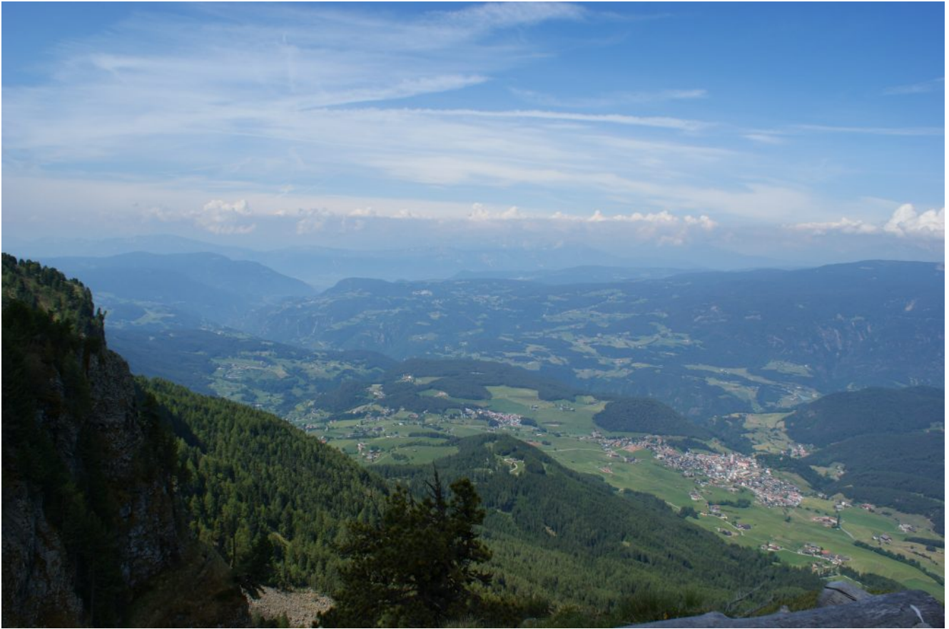
Blick von der Seiseralm nach Kastelruth und Bozen

Welche Wonne! Unten liegt ein Himmelstal Im Glanz der reinen Sonne. Wie der Weg sich senkt, Rücken neue Hügel, Berge vor – Rundum Glanz und Farbenpracht. Am Wege hohe Hecken Von blühenden Granaten, Glut auf Glut gedrängt. Wie voll, wie frisch, wie lachend Hier Kuß an Kuß Und Liebesgruß In grünen Zweigen winkt.