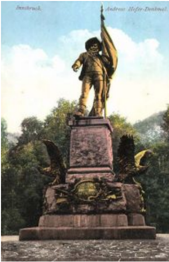
Alte Postkarte mit dem Andreas Hofer-Denkmal auf dem Bergisel

An Andreas Hofer erinnert auf dem Bergisel bei Innsbruck ein großes Denkmal, welches 1961 gesprengt und später wieder aufgebaut wurde.