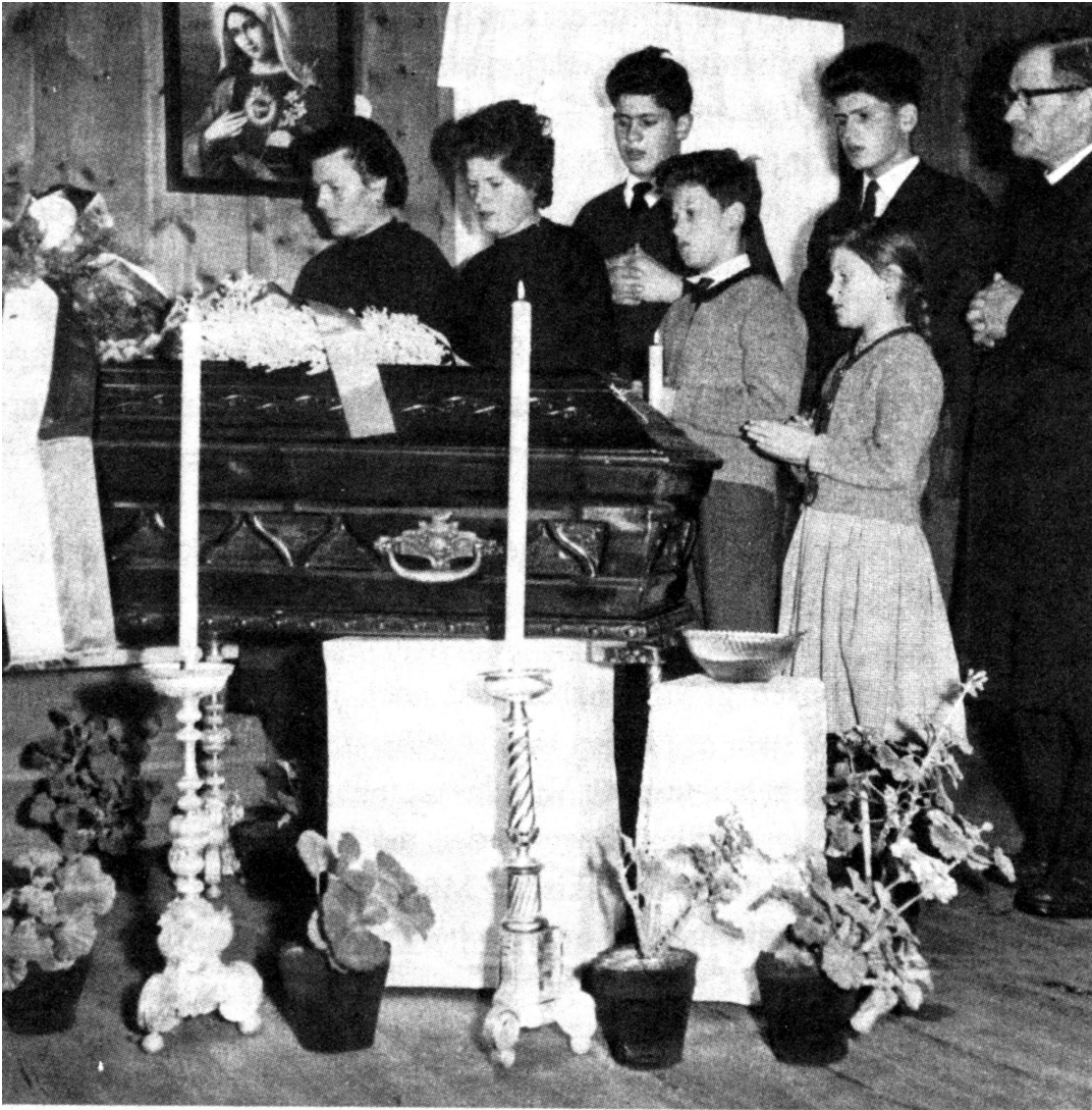
Letztes Geleit für einen gemarterten Südtiroler: Anton Gostner starb in einem italienischen Gefängnis