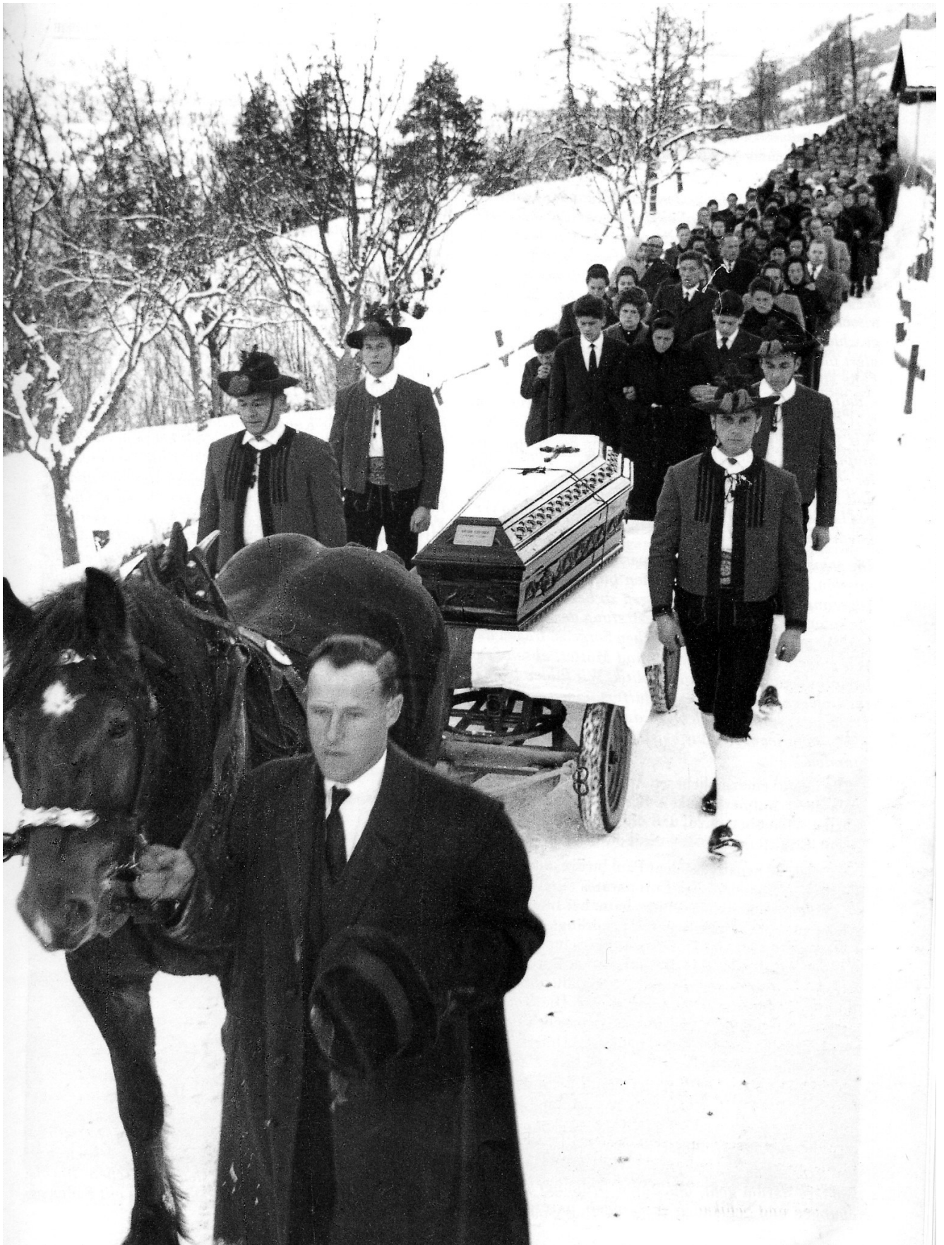
Unübersehbar lang war der Trauerzug