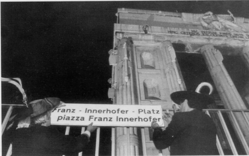
Aus Anlaß des 75. Todestages des von Faschistenhand ermordeten Lehrers Franz Innerhofer wird der umstrittene Siegesplatz in Bozen von einigen Schützen symbolisch in Franz-Innerhofer-Platz umbenannt.

24. April: Im Gedenken an den Lehrer Franz Innerhofer versammeln sich an dessen 75. Todestag knapp 1000 Schützen aus Süd-, Nord- und Welschtirol zu einer Gedenkfeier vor dem Ansitz Stillendorf in Bozen, wo der von Faschisten erschossene Innerhofer starb. Anschließend marschieren die Schützen in einem Schweigemarsch zum Siegesplatz, wo sie diesen symbolisch in Franz-Innerhofer-Platz umbenennen und vor dem Denkmal eine Dornenkrone niederlegen. Die Schützen werden von wütenden Protestrufen von mehreren hundert Anhängern der Neofaschisten begleitet. Nur das massive Polizeiaufgebot verhindert Ausschreitungen.