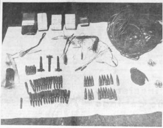
LA SQUADRA DI IL MATERIALI ESPLOSIVI E PROPRIETARI INTERSESTI SEQUESTRALE DELLE FORZE DELL'ORDINE IN VALLE AURINA A DESTRA NELL'ORDINE DELLE SPERIMENTAZIONI E SOTTOBASSO