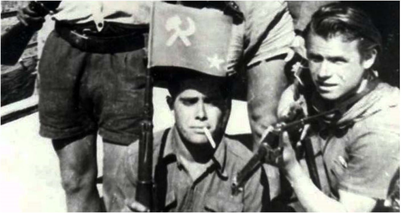
Stolz zeigen diese Partisanen ihre Gesinnung: Hammer und Sichel und Sowjetstern!