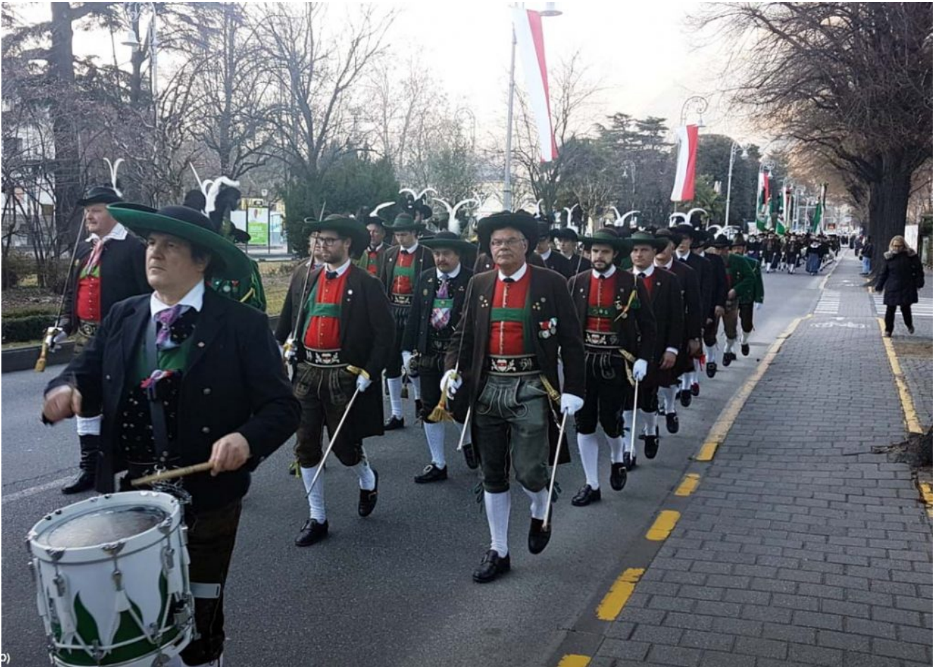
Der Zug zum Festplatz