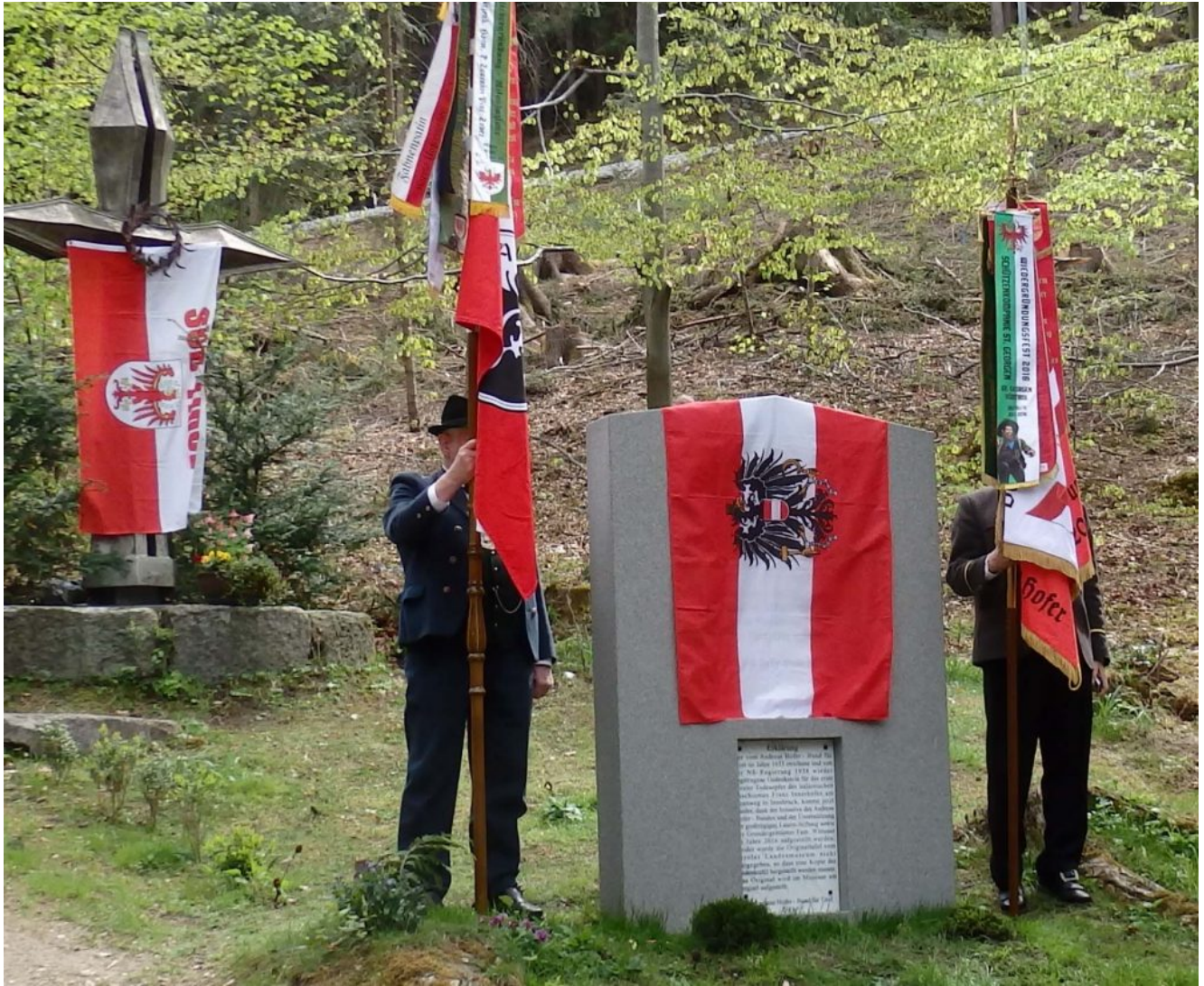
Die noch mit der österreichischen Flagge verhüllte Gedenktafel