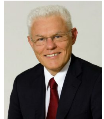
Der freiheitliche Südtirol- Sprecher und Nationalratsabge- ordnete Werner Neubauer

Die Regierungsparteien SPÖ und ÖVP schmetterten daher zusammen mit den „Grünen“ den Antrag des freiheitlichen Südtirol-Sprechers und Nationalratsabgeordneten Werner Neubauer ab, mittels Einfügen eines einzigen Absatzes im Staatsbürgerschaftsgesetz, den Südtirolern die doppelte Staatsbürgerschaft zu ermöglichen.