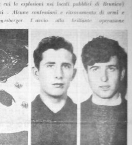
LA SCENDELLA DEL MATERIALI ESPLOSIVI E PROPRIETARI EREDITARI STATISTI DELLE FORZE DELL'ORDINE IN VALLE AURINA A DESTRA NELL'OROLOGIO SOVRIE D'INTERVISTE E SOVRIE SOVRIE