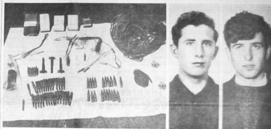
LA MONTAGNA DI IL MATERIALI ESPLOSIVI E PROPRIETARI SEQUESTRIATI DALLE FORZE DI POLIZIA IN VALLE AURINA. A DESTRA: I DUE GIOVANI IMPROVVISAMENTE ARRESTATI

Il cavaliere del lavoro Carlo Bazan è stato arrestato per aver favorito il Banco di Sicilia con un mutuo senza garanzie sufficienti.