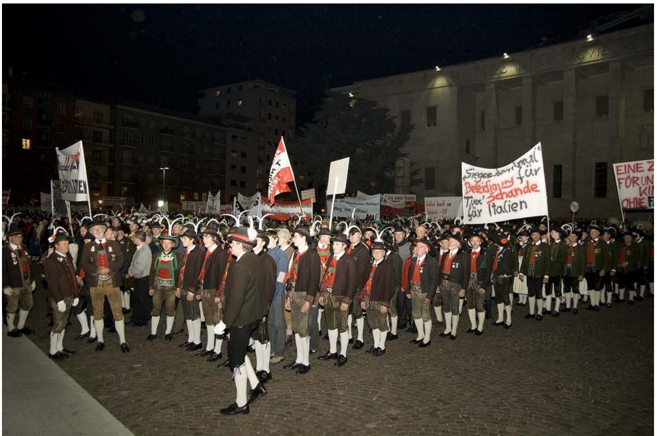
Auf dem Bozener Waltherplatz hatte sich eine riesige Menge von etwa 4.000 Schützen und Zivilisten versammelt.