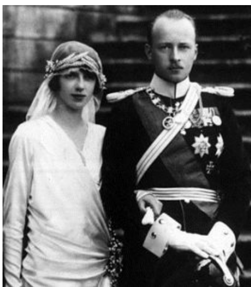
Prinz Philipp von Hessen mit seiner Gattin Mafalda

Was die Menschen nun bei Hitlers Einmarsch nicht wussten, war, dass zu diesem Zeitpunkt bereits ein Vertrauensmann Hitlers in Rom bei dem Diktator Benito Mussolini weilte. Es war dies Prinz Philipp von Hessen , ein Schwiegersohn des italienischen Königs und Gruppenführer der SA sowie Träger des Goldenen Parteiabzeichens der NSDAP.