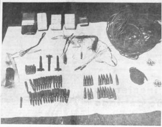
LA SUDIZIONE DI UN MATERIALE ESPLOSIVO E PROPAGANDISTICO SEQUESTRATO DALLE FORZE DI POLIZIA IN VALLE AURINA. A DESTRA: I DUE GIOVANI SEQUESTRATI A S. GIUSEPPE

Il documento comunista chiedeva che il governo si occupasse di risolvere il problema della Federconsorzi, che ha causato il licenziamento di 14 mila lavoratori.