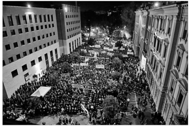
Schulter an Schulter standen die Schützen am Silvius-Magnago-Platz und spendeten den Rednern tosenden Applaus für ihre Forderungen. In 71 Bussen und zahlreichen Privatautos führen sie wieder nach Hause – die Letzten kurz nach 23 Uhr.