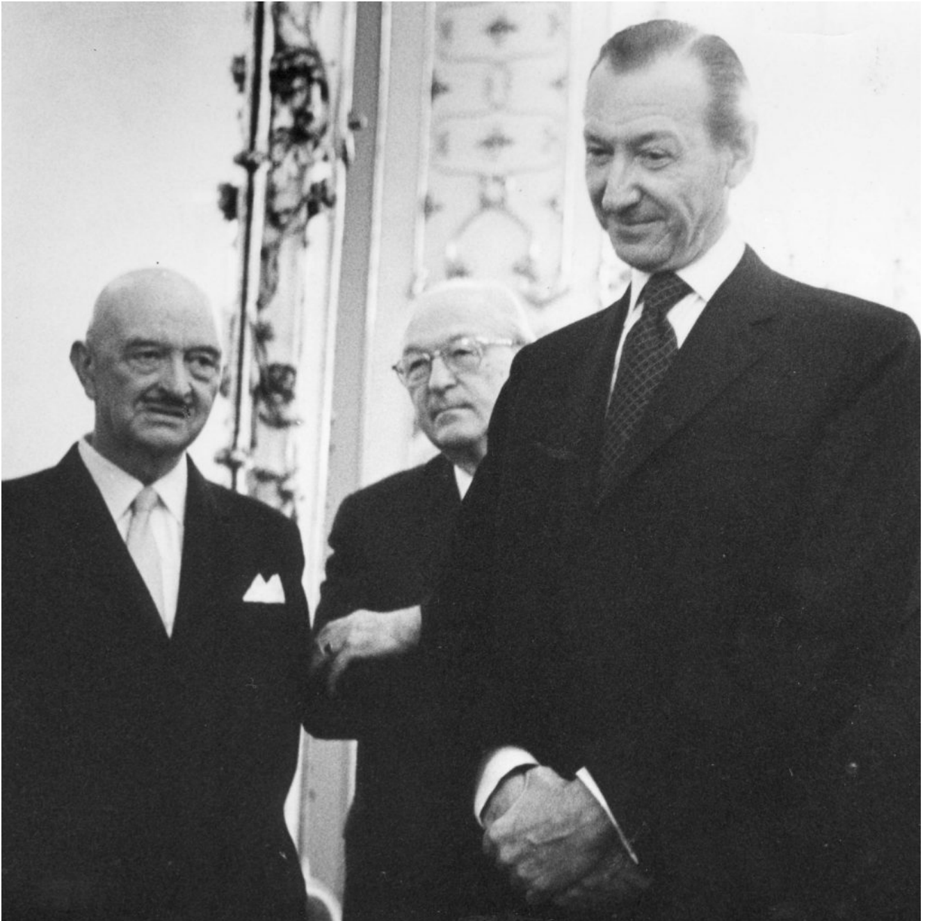
Rudolf Moser (links) mit Außenminister Dr. Kurt Waldheim (rechts)

Mosers vielfältiges und nicht eben einflusslos gebliebenes Wirken beschränkte sich indes nicht auf die eines Kontaktknüpfers oder Verbindungsmannes zwischen ÖVP und DC. Er betätigte sich auch auf internationalem Parkett und vertrat die ÖVP auf den seit 1947 stattfindenden jährlichen Parteikongressen der DC sowie auf den Jahrestagungen der „Nouvelles Équipes Internationales“ (NEI), die sich 1965 in „Union Européenne des Démocrates-Chrétiens“ (EUDC) / „Europäische Union Christlicher Demokraten“ (EUCD) umbenannte.