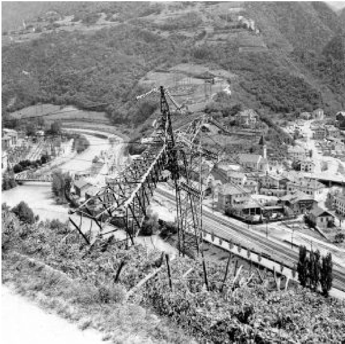
In der „Feuernacht“ gesprengter Mast in Südtirol.

Die Aufmerksamkeit der gesamten Welt auf Südtirol zu richten, gelang in der Folge des Donnerschlages auch durch den persönlichen Einsatz des damaligen österreichischen Außenministers Dr. Bruno Kreisky vor der UNO.