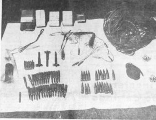
LA SUIVITA DI UN MATERIALE ESPLOSIVO E PROPAGANDISTICO SEQUESTRATO DALLE FORZE DI POLIZIA IN VALLE AURINA A OVESTRA NELL'ULTIMO QUINTE DI GENNAIO 1967

Con i partiti di centrosinistra hanno votato anche le destre - Isolati PCI e PSU - 14 deputati socialisti hanno tuttavia infranto la disciplina di gruppo I provvedimenti del Consiglio dei ministri nel settore degli ortofrutticoli in relazione alle norme del MEC