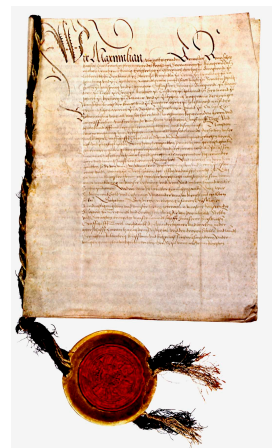
Das von Kaiser Maximilian 1511 erlassene