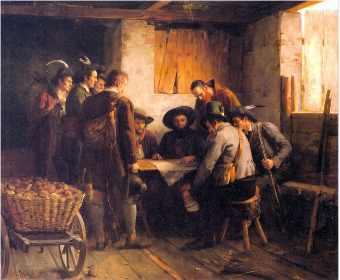
Kriegsrat Andreas Hofers (Gemälde von Franz von Defregger)