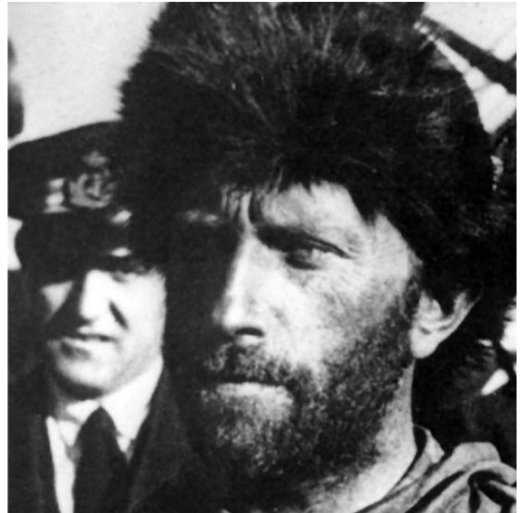
Bild links: Bericht aus „Der Südtiroler“ vom 1. November 1928. Bild rechts: Der gescheiterte Polar-Held nach seiner Rettung.