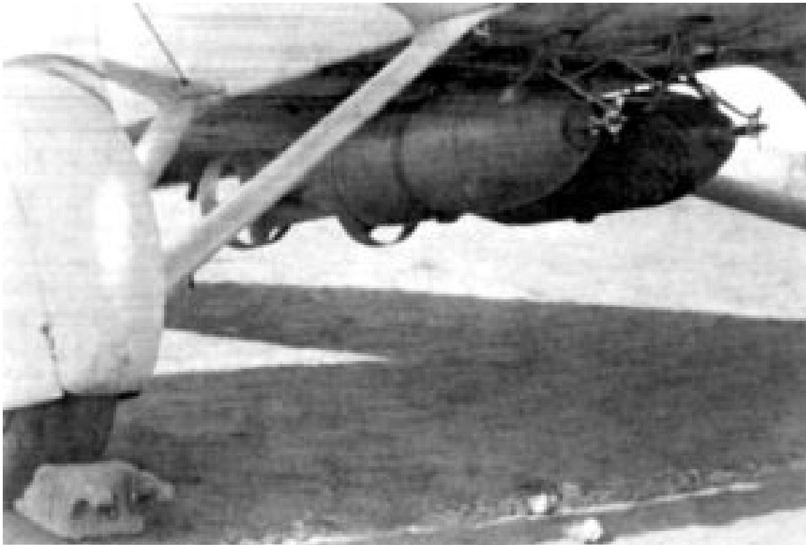
Giftgasbomben unter der Tragfläche eines italienischen Kampfflugzeuges