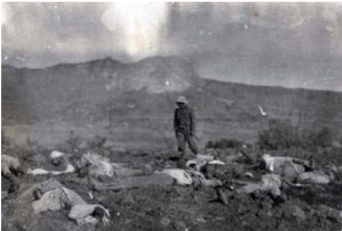
Mit Giftgas getötete Äthiopier

1937 wurde Oberstleutnant Gennaro Sora nach Äthiopien geschickt, um als Kommandant eines Alpinibataillons der 8. Brigade (ehemals Divisione Pusteria) sogenannte