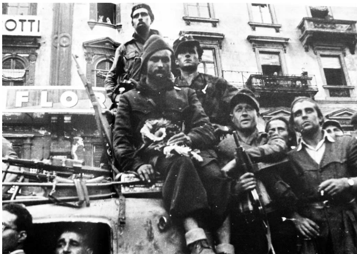
Italienische „Nachkriegspartisanen“ in Bozen.