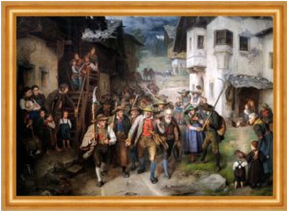
„Das letzte Aufgebot“. Gemälde von Franz v. Defregger.

„Da kommen sie schon angefahren im Sturmschritt, die alten Racker und Lotter mit den krummen Rücken, Knien und Ellebögen, mit den weißen Haarstränen und den Stoppelbärten, auf den Achseln die Spieße und Sensen und Morgensterne und Stallgabeln und Hacken, gezähnte Messer auch und rostige Lanzen und Flinten. Alle in mausgrauen, abgenützten Lederhosen, alten Joppen und breiten Filzhüten. Voran marschiert der stolze Bauer, das Brennscheit umgekehrt auf der Schulter tragend und unterwegs die Weisung schnaufend – wohin und wie anpacken, zu seiner rechten trabt der Zimmermann mit einem eisenzähnigen, stahlbespitzten Schlagprügel, der vor Zeiten schon auf die Türkenschädel niedergesaust sein soll. Ihm daneben der Richter von Villanders, dem das Recht in diesen Tagen zum Messer geworden ist. Links vom Bauer der weißbärtige Feldkaplan Gruber, in seinem mächtigen Joppensack nicht die geringste der Waffen, schleppend einen wuchtigen Brotlaib und einen Rosenkranz. Und hinter alle anderen, Wäldler und Bergler, Hirten und Holzerer, Handwerker, Knechte und Bauern, Zündler und