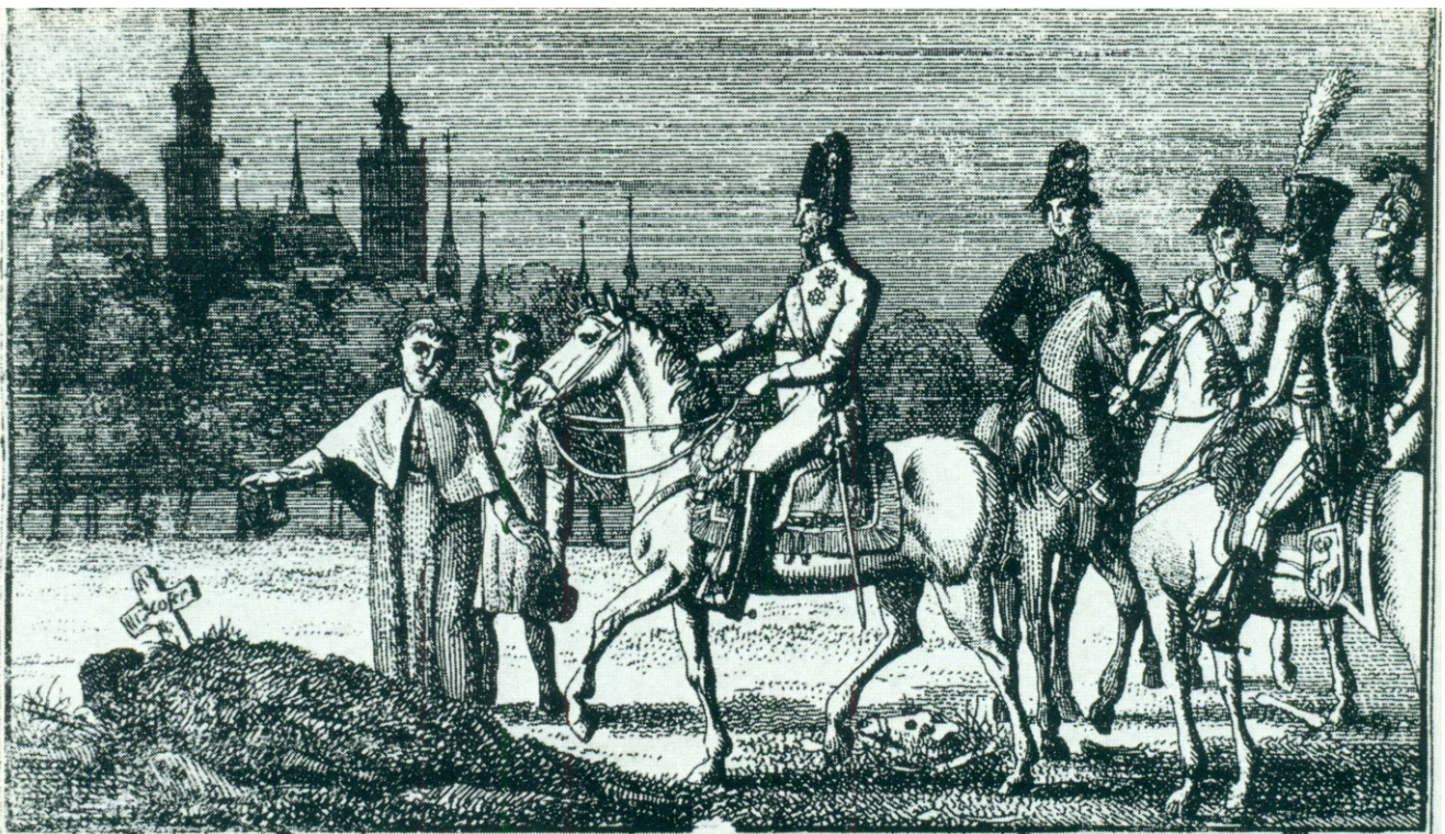
Der Kaiser Franz I. besucht das Grab des Andreas Hofer.

Klemens Wenzel Fürst Metternich wollten wohl das Tirol gegebene Versprechen totschweigen. Der Sandwirt wurde als „gefährlicher Rebell“ bezeichnet. Nach Rückkehr Tirols zu Österreich wurde alle Literatur über den Aufstand und Andreas Hofer von der Zensur verboten. Die Landstände in Tirol erhielten keine legislativen oder exekutiven Rechte mehr, die sie sich vom Haus Habsburg erhofft hatten. Unter Metternich durften sie nur Petitionen einreichen, die gehört wurden. Viele Teilnehmer des Aufstands gingen ins Exil, hatten oftmals ihren gesamten Besitz verloren oder standen unter Beobachtung des Metternichschen Spitzelsystems.“