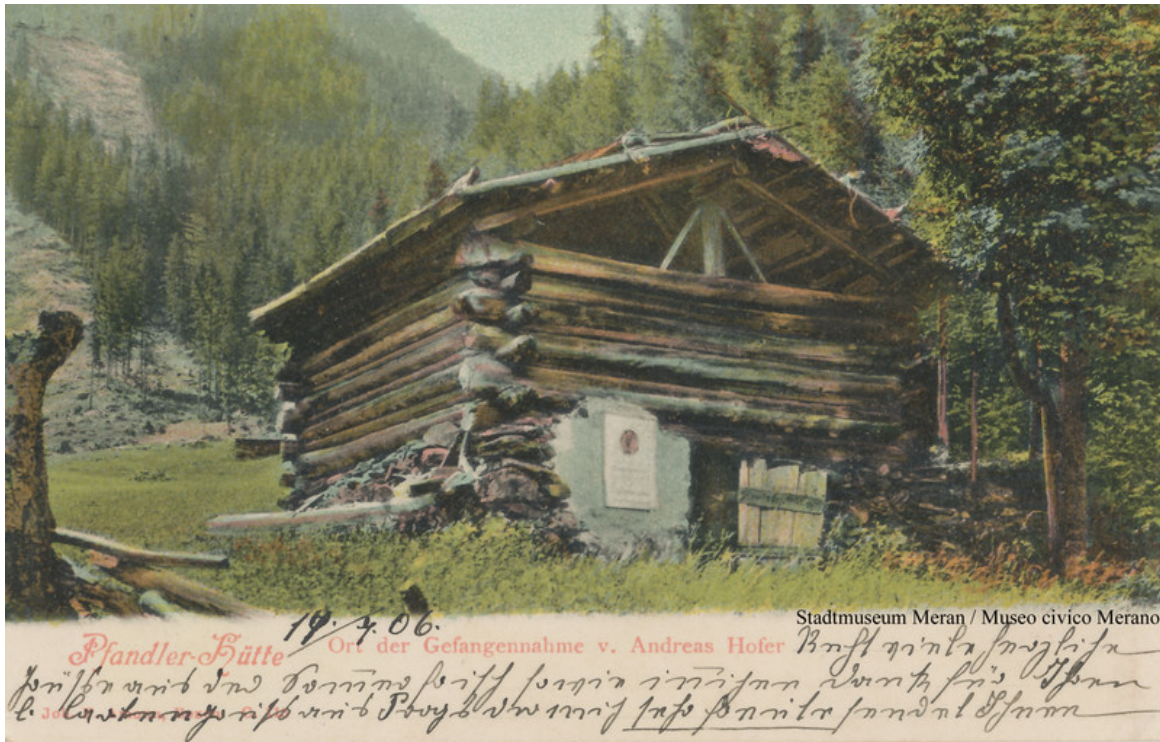
Postkarte mit der Mäherhütte auf der Pfandleralm.