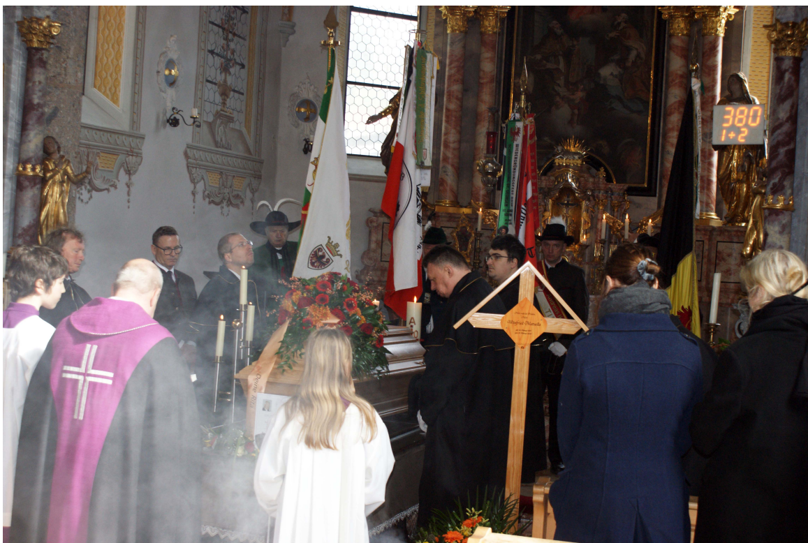
Die Trauergemeinde in der Kirche